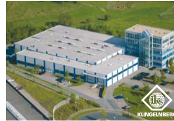
IKS Klingelberg GmbH, Reimscheid

IKS KLINGELBERG GMBH Headquarters & Sales In der Fleute 18 D-42897 Reimscheid Germany T: +49 (0) 2191-969-0 F: +49 (0) 2191-969-111 E-Mail: info@interknife.com www.interknife.com