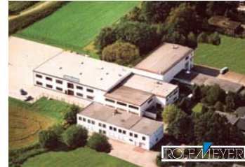
Rolf Meyer GmbH, Bargteheide

ROLF MEYER GMBH Sales & Production Heinrich-Hertz-Straße 17 22941 Bargteheide Germany T: +49 (0) 4532 / 400-0 F: +49 (0) 4532 / 400-200 E-mail: info@rolfmeyer.de www.rolfmeyer.de