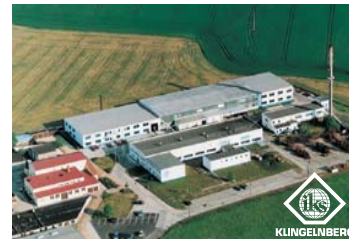
IKS Messerfabrik Geringswalde GmbH, Geringswalde

IKS KLINGELBERG GERINGSWALDE GMBH Production Mittweidaer Straße 44 D-09326 Geringswalde Germany Tel. +49 (0) 37382-846-0 Fax +49 (0) 37382-846-24 E-Mail: iksgw@interknife.com www.interknife.com